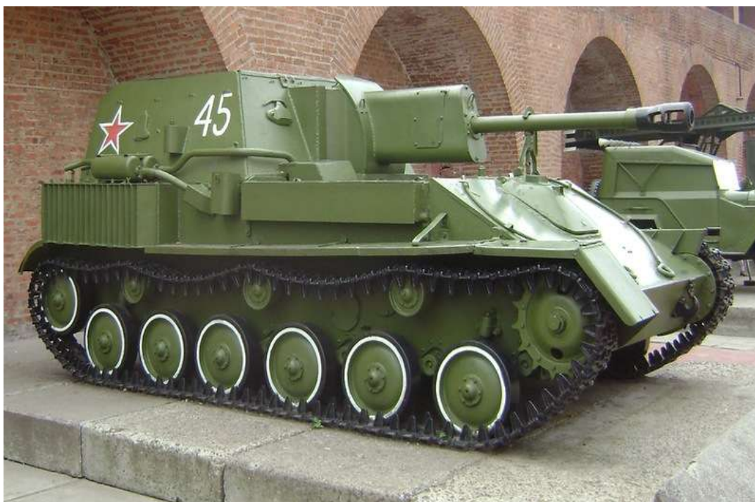
Танковая самоходная установка СУ-76