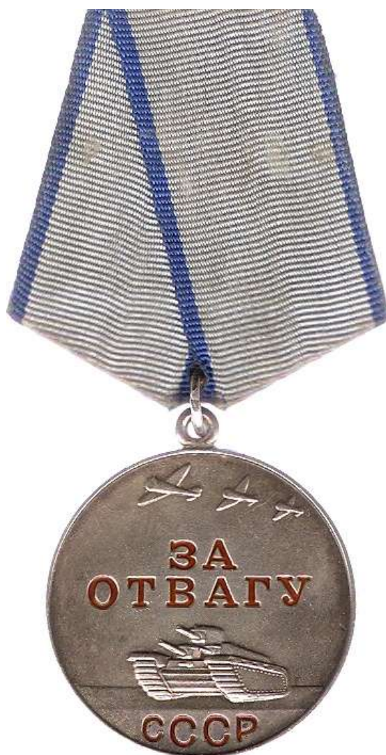
Медаль за отвагу