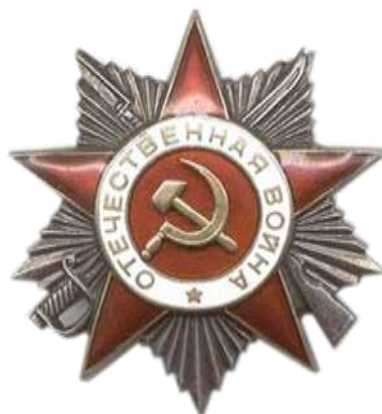
Орден Отечественной войны II степени