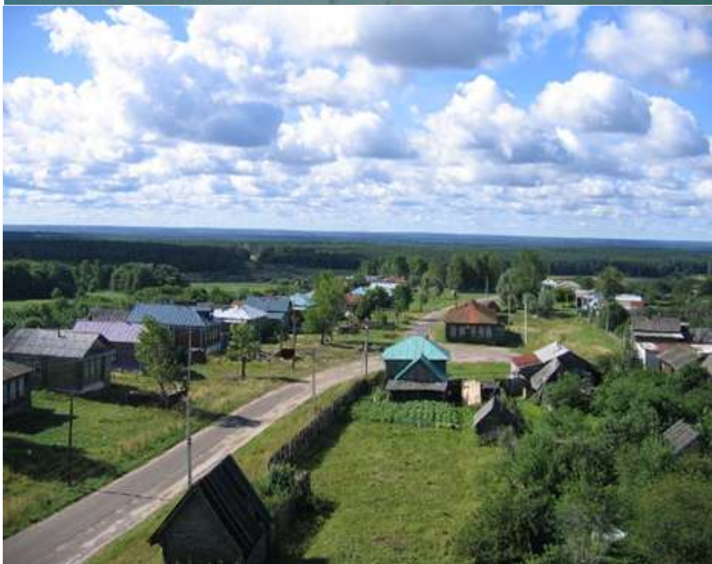
Нижегородская обл. Сосновский район, село Панино.